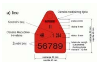
ZAMJENSKA UŠNA MARKICA ZA KOZE