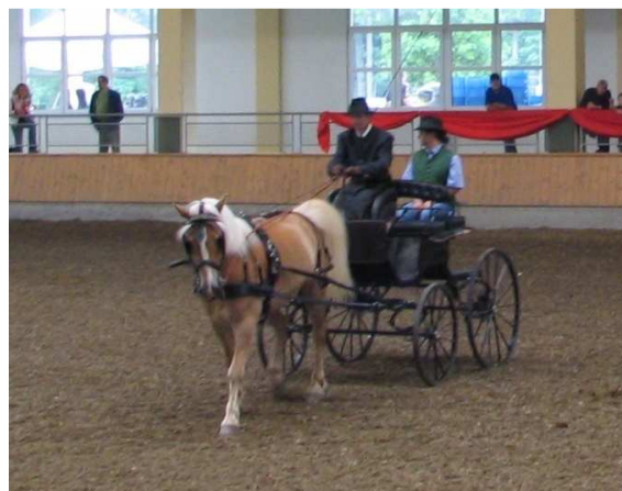
Foto 5. Polaganje IRS u zaprezi