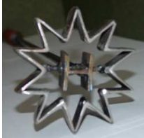
Foto 3. Vrući žig kojim se označavaju haflinger grla u RH

Nakon označavanja sukladno uzgojnom programu Izdavatelj sukladno Pravilniku o identifikaciji i registraciji kopitara izdaje Identifikacijski dokument kopitara (ID).