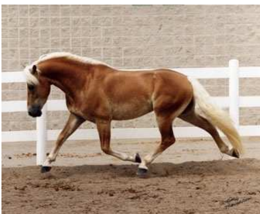
Foto 1. Rasplodni haflinger pastuh