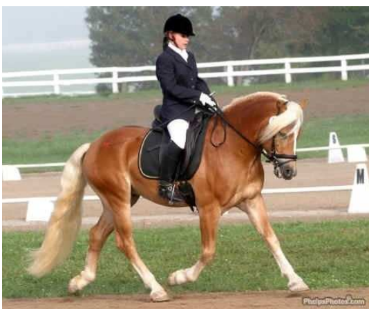
Foto 4. Polaganje IRS pod sedlom

Kretnje: Ocjenjuje se korektnost i izdašnost u koraku, kas i galopu, po jednakim kriterijima kao kod ocjene svojstava vanjštine. Korak mora biti korektan, izdašan, energičan i dug, te pravilan – četverotaktan. Kas mora biti korektan, izdašan, energičan i dug, te pravilan – dvotaktan, s dugom fazom lebdenja. Posebna pozornost kod ocjene kasa posvećuje se radu zadnjeg dijela tijela – noge, sapi i leđa. Galop mora biti izdašan, energičan i dug, pravilan – trotaktan, s jasnom i dugom fazom lebdenja. Nepoželjno je nekorektno kretanje u svim hodovima, neizdašno, nisko kretanje, kratki koraci, spoticanje, nejednaka izmjena nogu, nejasna taktnost kretnji, kljusanje u hodu i kasu, četverotaktni galop i dr.