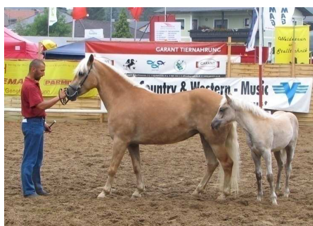
Foto 2. Rasplodna haflinger kobila s ždrebetom